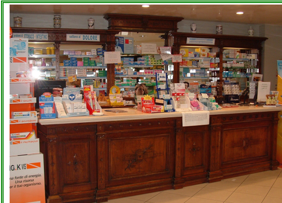
Farmacia Manganotti Via Poscolle, 10 Udine