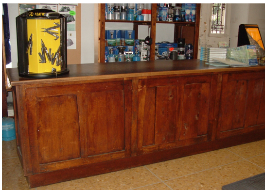
Fiascaris Viale Tricesimo, 35 Udine