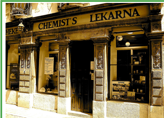
Farmacia Fornasaro Corso Mazzini, 24 Cividale del Friuli (UD)