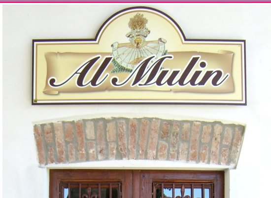
Al Mulin Via Tomadini, 82 Talmassons (UD)