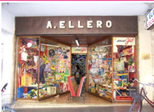
Cartoleria Ellero Corso Vittorio Emanuele II, 29 Pordenone