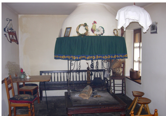
Osteria di Nonta Via San Maurizio, 1 Nonta Socchieve (UD)