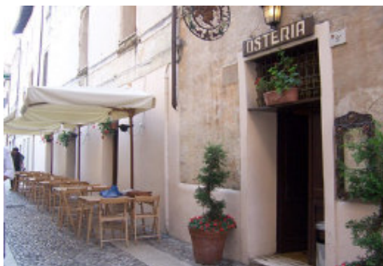
La Vecia Osteria del Moro Via Castello, 2 Pordenone