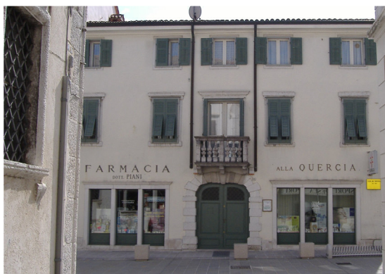
Farmacia Alla Quercia Via Ciotti, 26 Gradisca d'Isonzo (GO)