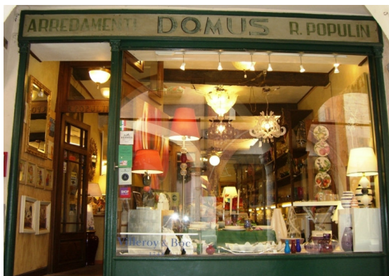
Populin Riccardo Domus Corso Vittorio Emanuele II, 9/A Pordenone