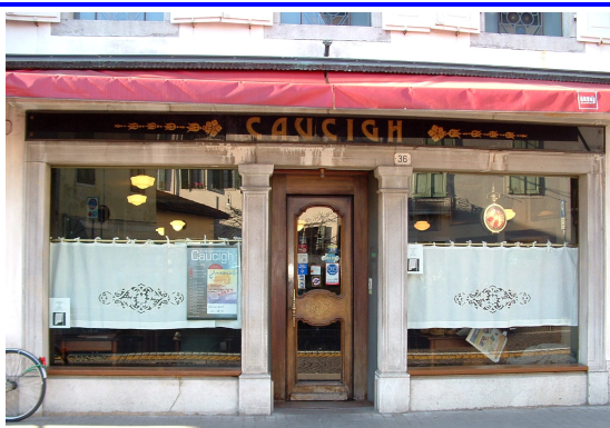
Caucigh Bar Pasticceria Via Gemona, 36 Udine