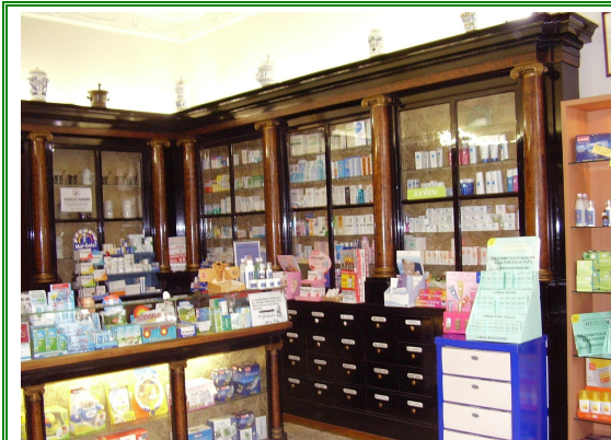
Farmacia Lipomani Borgo Aquileia, 22 Palmanova (UD)