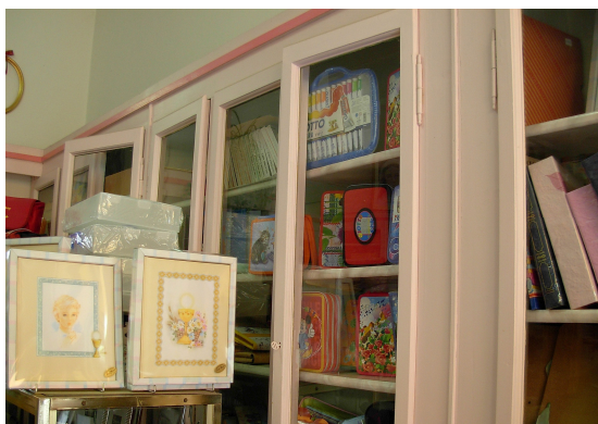
Cartoleria Aviani Via Mazzini, 12 Spilimbergo (PN)