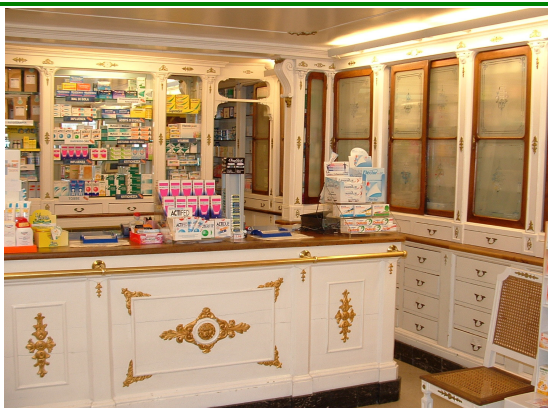
Farmacia Alla Loggia del dott. Beltrame Piazza Libertà, 9 Udine