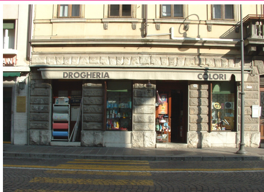
Drogheria Tosolini Via Aquileia, 68/A Udine