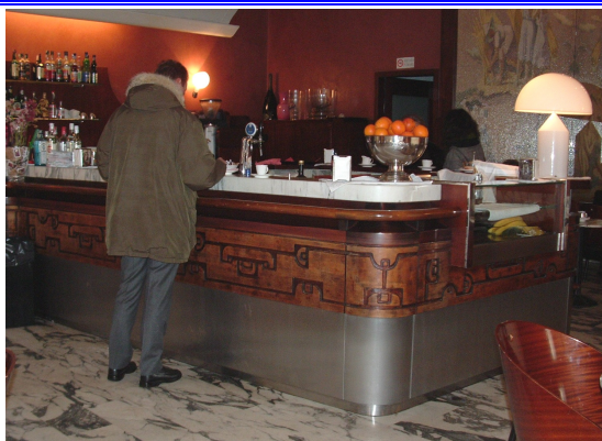
Bar Delser Via Cavour, 18 Udine