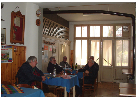
Bar Coloniali Pozzo Piazzale Cella, 9 Udine