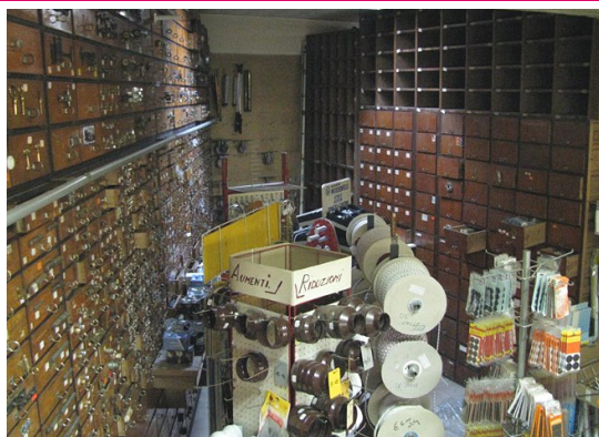
Ferramenta De Colle Via Battisti, 6 Villa Santina (UD)