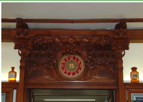
Farmacia Cadamuro Via Mercatovecchio, 22 Udine