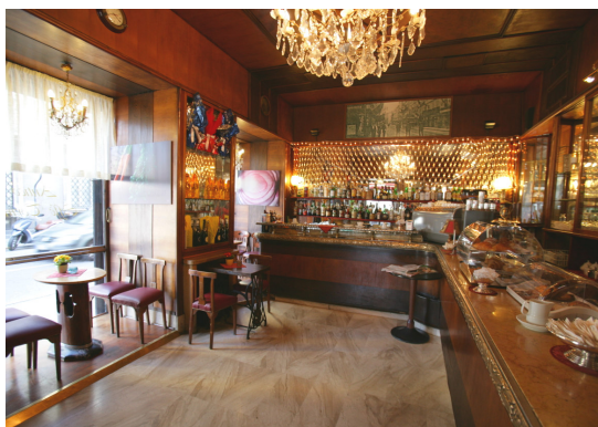
Antico Caffé Torinese Corso Italia, 2 Trieste