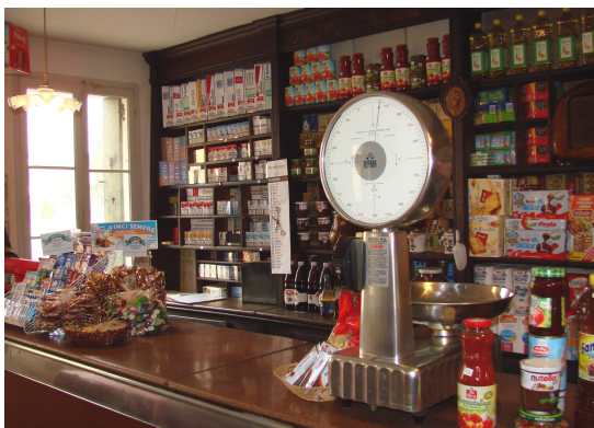
Pascotto Elvira Piazza San Michele Arcangelo, 27 Fagnigola Azzano Decimo (PN)