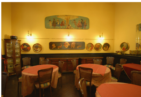
Antico Caffé San Marco Via Battisti, 18 Trieste