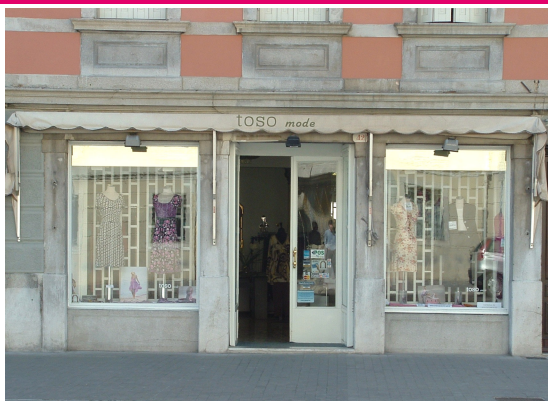
Toso Mode Via Gemona, 42 Udine