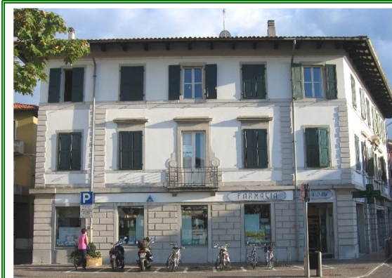
Farmacia Di Lenarda Piazza Libertà, 5 Tarcento (UD)