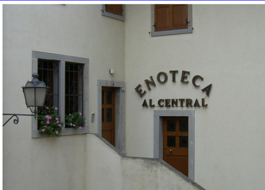
Al Central Via Vicinale, 4 Gemona del Friuli (UD)