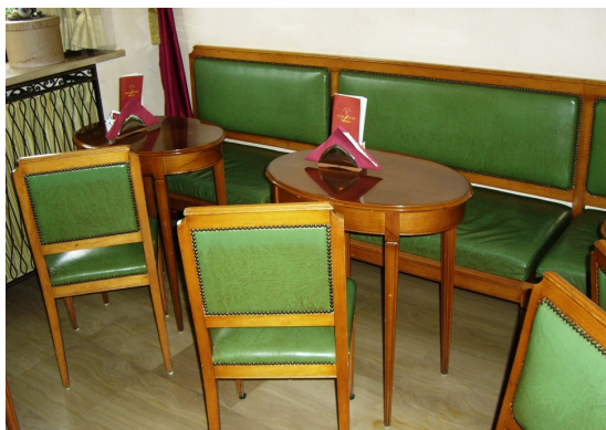
Pasticceria Peratoner Corso Vittorio Emanuele II, 22/B Pordenone