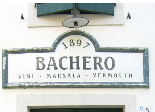
Osteria Al Bachero Via Pilacorte, 5 Spilimbergo (PN)