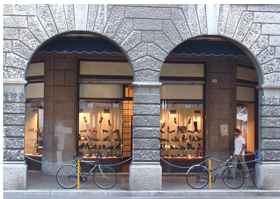
Calzature Marcolini "Zenith" Piazza Marconi, 9 Udine