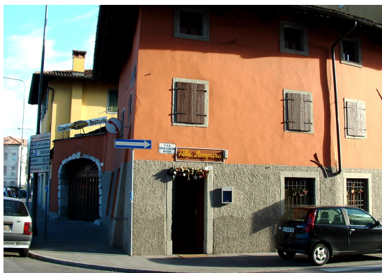
Pizzeria Trattoria Alla Lampara Via A. L. Moro, 63 Udine