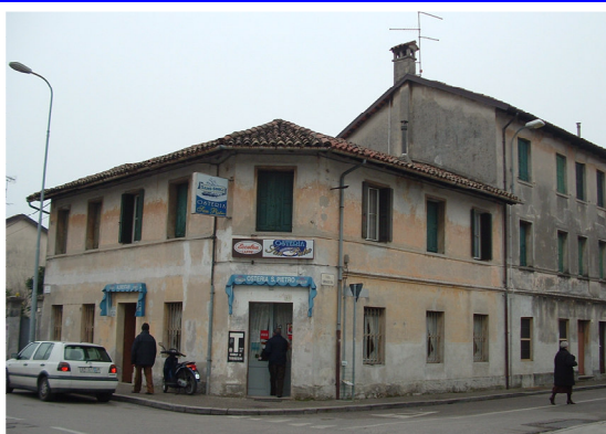
Osteria e alimentare San Pietro Via Lumignacco, 87/89 Udine