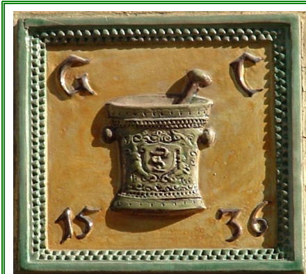
Farmacia Santa Lucia del dott. Colutta Via Mazzini, 13 Udine