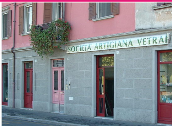
SO.AR.VE. Società Artigiana Vetrai Piazzale D'Annunzio, 30 Udine