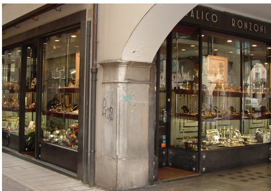
Italico Ronzoni Gioielleria Orologeria Via Mercatovecchio, 10 Udine