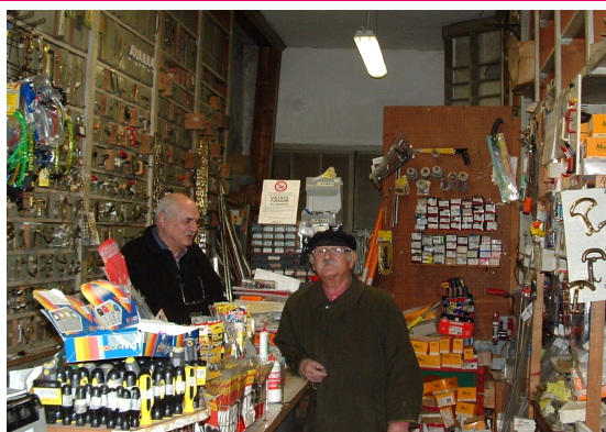
Chiarandini Giuliano & C. Ferramenta Piazza Marconi, 7 Udine