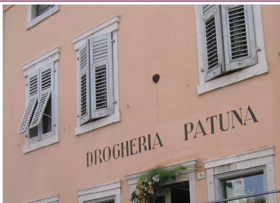
Drogheria Patuna Via Ciotti, 16 Gradisca d'Isonzo (GO)