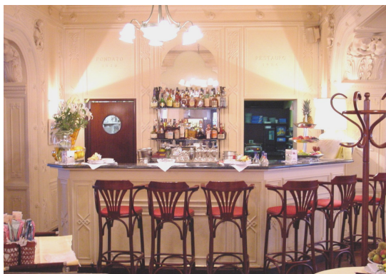
Caffé Tommaseo Piazza Tommaseo, 4 Trieste