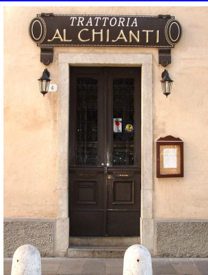
Trattoria Al Chianti Via Marinelli, 4 Udine