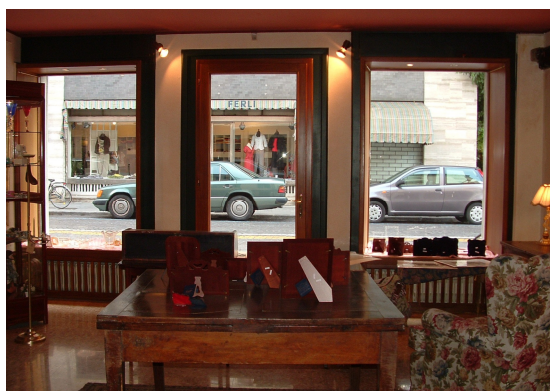
Del Fabro Oggetti d'arte Via Gemoni, 68 Udine