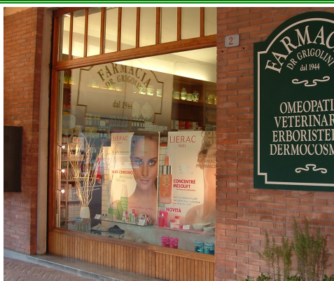
Farmacia Dr. Grigolini Piazza del Popolo, 2 Torviscosa (UD)