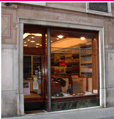
Furio Furlanetto Tessuti Confezioni Via Cavour, 17/B Udine