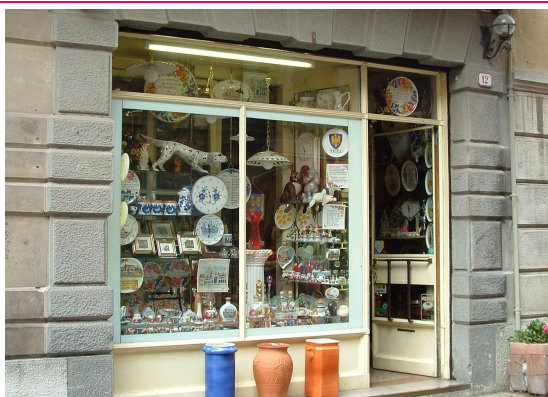
Trangoni Angela Via Pelliccerie, 12 Udine