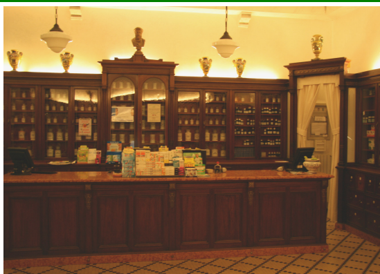
Farmacia Minisini Largo Boiani, 11 Cividale del Friuli (UD)