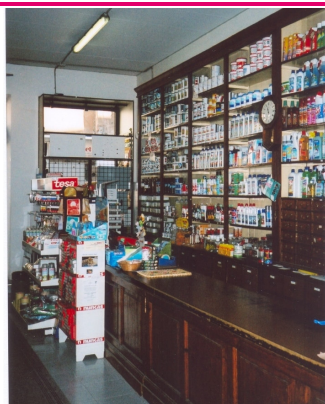
Mazzoli Drogheria e Ferramenta Corso del Popolo, 5 Monfalcone (GO)