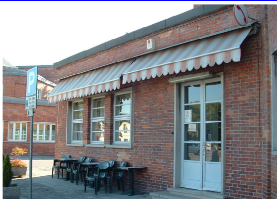
Bar Circolo Piazza F. Marinotti, 1 Torviscosa (UD)