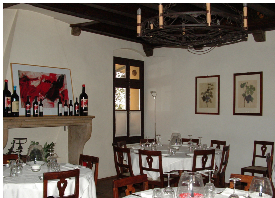
Trattoria Ai Frati Piazzetta Antonini, 5 Udine