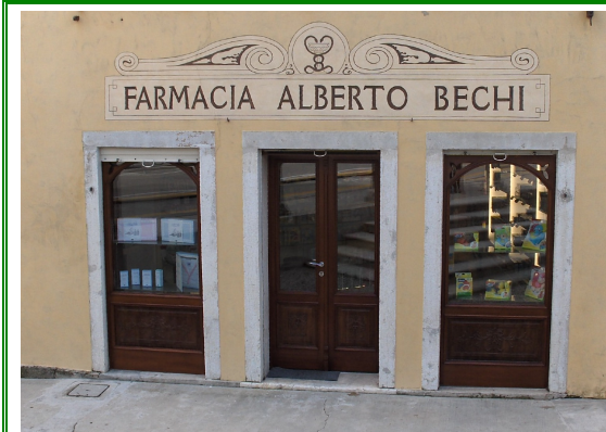
Farmacia Alberto Bechi Piazza del Popolo, 31 Sacile (PN)