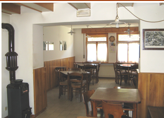
Da Biagio Frazione Osais, 10 Prato Carnico (UD)