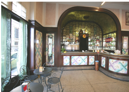
Bar Cattaruzza Piazza Duca degli Abruzzi, 5 Trieste