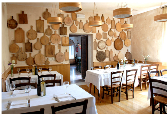
Al Parco Via Stretta, 7 Buttrio (UD)