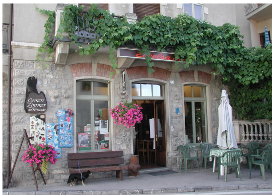
Bar Centrale Via Roma, 33 Comeglians (UD)