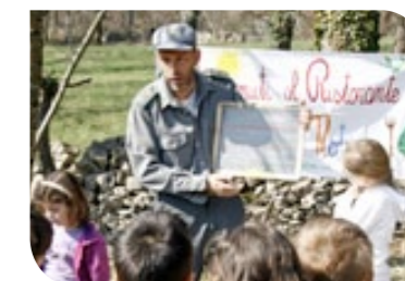
Centro Didattico Naturalistico di Basovizza

Appuntamenti per i grandi, ma soprattutto per i piccini: alla scoperta di alcuni aspetti del mondo naturale del Friuli Venezia Giulia con semplici, coinvolgenti e divertenti giochi di Pedagogia forestale e di Educazione alla terra. Per trasformarsi in qualche animale o per comprendere gli alberi e le reti alimentari del bosco, il Corpo forestale regionale vi aspetta alle ore 10.30, 11.30, 12.30 e 14.30.