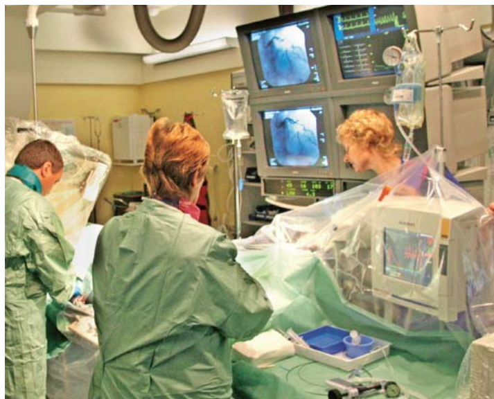
... per operazioni chirurgiche in Svezia