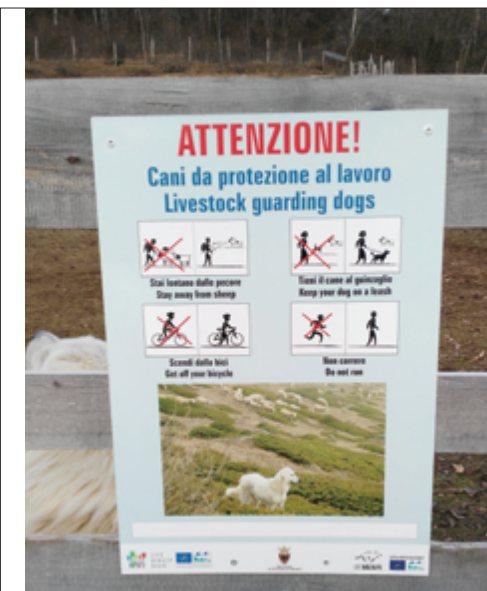
Immagine 7: Cartello informativo sulla presenza sul pascolo di cani da guardiania e sui comportamenti corretti da mantenere. Autore: Daniele Asson

possa all'occorrenza ritirarsi, scappare o proteggersi dalle reazioni difensive talvolta violente degli animali allevati. L'obiettivo di base deve essere quello di lasciare il più possibile il cane a stretto contatto con il gregge/mandria. Tale lavoro deve procedere per gradi; all'inizio il cane deve essere inserito in un piccolo gruppo di animali tranquilli e tolleranti e deve essere tenuto regolarmente controllato per poi essere gradualmente inserito con tutto il gregge/mandria. I cani una volta adulti devono essere tenuti a stretto contatto con il gregge o con la mandria durante tutto il periodo invernale in modo da sviluppare attaccamento e affezione verso gli animali.