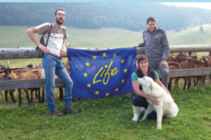
Uno dei cani consegnati dalla Provincia Autonoma di Trento (Italia).

Nel 2018, su stimolo della Provincia di Trento, è