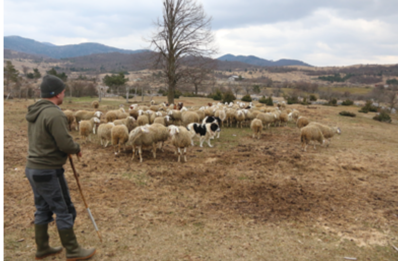
Immagine 5: Un numero maggiore di cani fa crescere l'affidabilità e aumenta la protezione dai predatori.

E' consigliabile dare da mangiare al cane nella zona dove si trovano gli animali che deve proteggere, per esempio al pascolo o nella stalla; in questo modo il cane non sarà tentato ad abbandonare il gregge per cercare o chiedere cibo. Il cibo deve essere protetto in modo che non possa essere mangiato da altri animali.