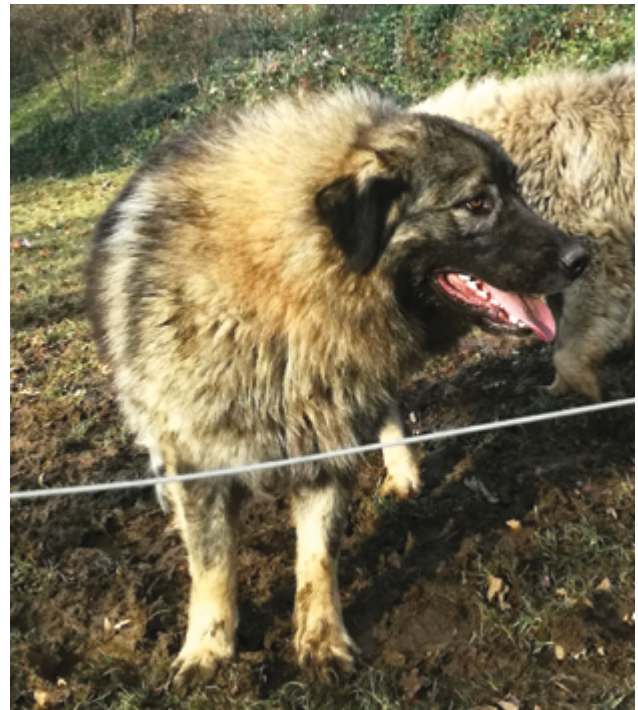
Immagine 9: Si consiglia di scegliere un cucciolo discendente da cani da lavoro.

Un allevatore esperto di cani da guardiania sarà in grado di riconoscere i primi segni che indicano se il cucciolo è adatto o meno a diventare un buon cane da guardiania e sarà in grado quindi di consigliare al meglio il cliente nella scelta del cucciolo.