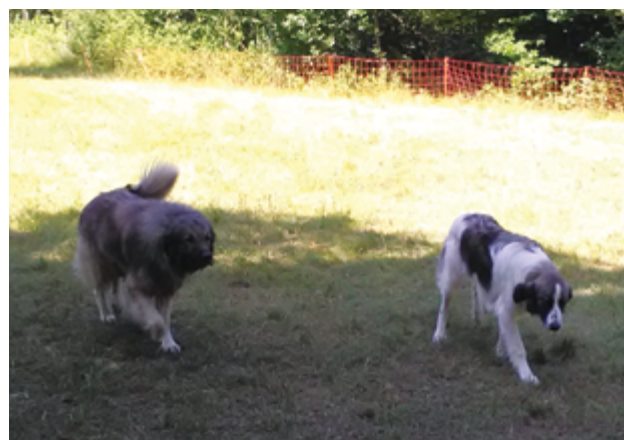
Immagine 13: Cane da pastore jugoslavo o Sarplaninac e un cane Torniak di un anno e mezzo.

di protezione del gregge/mandria attraverso i cani da guardiania, i cuccioli andranno inseriti individualmente, uno alla volta, altrimenti la presenza di troppi cuccioli che ancora giocano fra di loro potrebbe impedire lo sviluppo del senso di attaccamento al gregge/mandria.