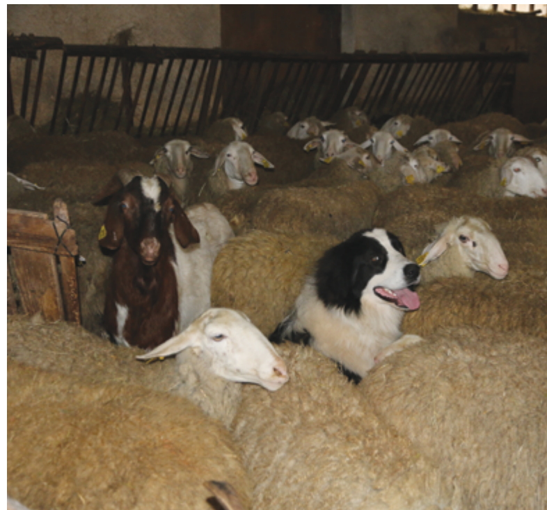
Immagine 8: I cani passano tutto il tempo con gli animali del gregge/mandria, anche durante la stagione invernale, quando gli animali vengono tenuti in stalla.

La stagione invernale solitamente è il momento in cui l'impegno per l'attività di allevamento è ridotto, ed è quindi il momento più indicato per dedicarsi all'introduzione di un giovane cane da guardiania nel gregge/mandria. In questo periodo gli animali allevati sono solitamente gestiti al chiuso in stalla, che rappresenta un ambito definito, contenuto e adatto per l'inserimento del cane. In tale ambito l'allevatore ha la possibilità di osservare il cane e vedere come questo si comporta con gli animali allevati e come questi reagiscono. E' consigliabile preparare una cuccia in cui il cane