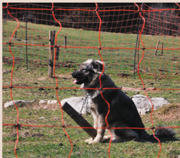
Immagine 17: Un giovane Cane da Pastore maremmano abruzzese a contatto con giovani ovini.