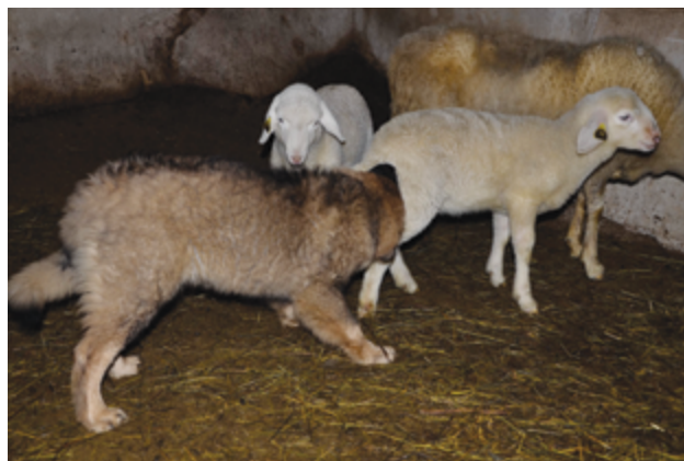
Immagine 12: Giovane cane da pastore del Carso che familiarizza con l'agnello annusandolo.