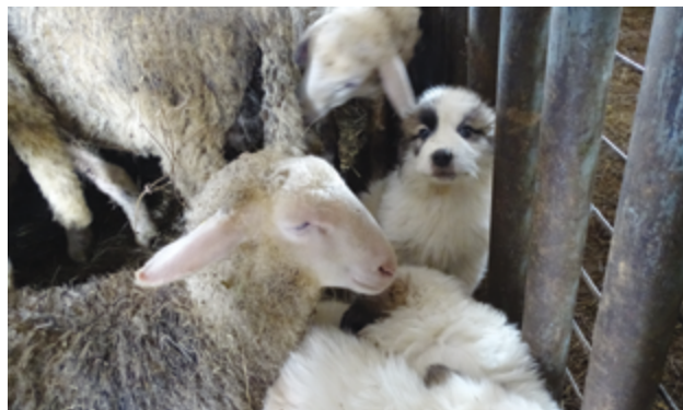
Immagine 10: È importante che i cuccioli si abituino agli animali del gregge/mandria già a partire dall'ottava settimana di vita.

Se il gregge/mandria sono protetti da un cane adulto già formato, il cane giovane deve essere inserito gradualmente per prevenire ogni possibile reazione difensiva da parte del cane adulto. L'educazione del cane giovane verrà quindi in gran parte impartita dal cane adulto sotto la sorveglianza del pastore; il cane giovane imparerà infatti imitando il cane adulto. Quest'ultimo terrà inoltre calmo il cane giovane e impedirà che manifesti comportamenti scorretti. Se siamo solo all'inizio del processo