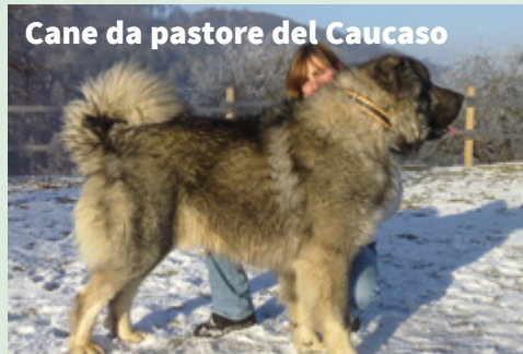
Cane da pastore del Caucaso