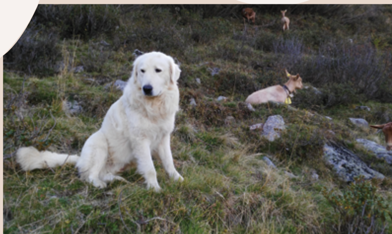
Immagine 2: Il Cane da Pastore Maremmano Abruzzese è la razza di cani da guardiania più diffusa in Italia. E' inoltre una specie autoctona.

istinto protettivo molto marcato istinto di branco marcato istinto predatorio scarsamente sviluppato