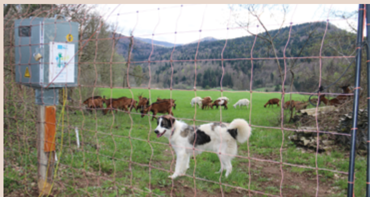
Immagine 19: La recinzione elettrificata può facilitare il legame al gregge e al pascolo nelle fasi iniziali introduzione di un nuovo cane.

Dobbiamo favorire lo sviluppo dell'istinto innato nel cane di legame al gregge e al pascolo (alimentazione in prossimità del gregge; disincentivare il legame con le persone), correggendo eventuali fughe, che non devono diventare un'abitudine. In fase iniziale, può essere utile a tal fine abituare il cane a stare all'interno della recinzione elettrificata, che rappresenta un ostacolo non solo fisico ma soprattutto psicologico, una volta sperimentato il contatto con l'elettricità.