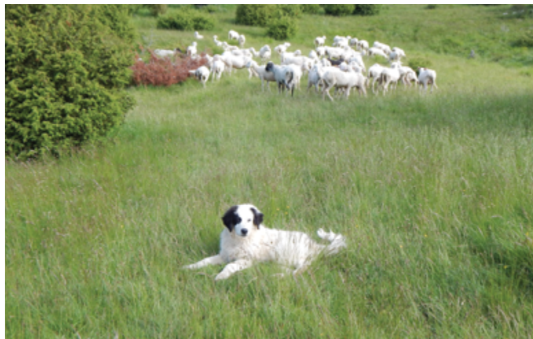
Immagine 4: I cani da guardiania passano tutta la vita accanto al gregge o alla mandria.