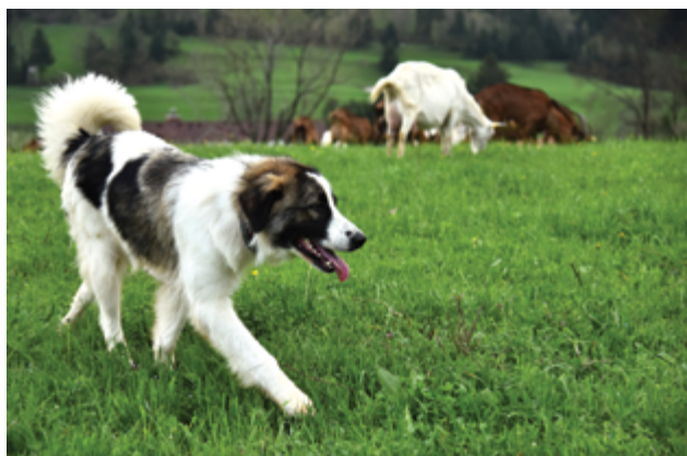
Immagine 14: E' importante osservare attentamente il cane quando viene portato le prime volte al pascolo assieme al gregge/mandria.

Dalle prime settimane fino a circa un anno e mezzo di vita, il cane deve essere regolarmente e frequentemente controllato mentre si trova con il gregge/mandria, sia di nascosto, sia apertamente. In questo modo è possibile verificare se si può fare affidamento su di lui. La regolare e frequente supervisione permette anche di trovare una rapida soluzione nel caso di problemi, fattore di cruciale importanza per eliminare rapidamente comportamenti scorretti, che potrebbero via via trasformarsi in cattive abitudini. L'eliminazione dei comportamenti scorretti deve quindi essere puntuale, efficace e costante. Maggiori informazioni al Capitolo 7.