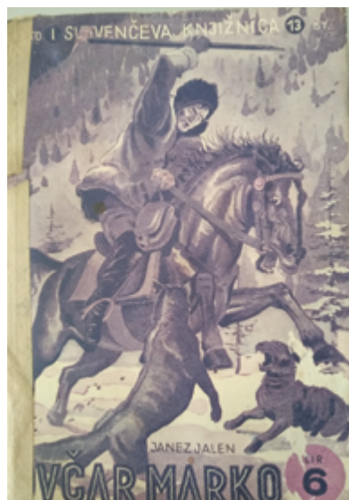
Immagine 3: Il romanzo Ovčar Marko di Janez Jalen, che parla di un cane da pastore del Carso.

Cominciarono a svilupparsi due tipi diversi di cani, con caratteristiche e capacità differenti. I cani più piccoli, più agili e vigorosi, con un istinto di caccia più pronunciato tenevano insieme e conducevano le greggi e le mandrie, andavano a riprendere gli animali che si allontanavano ed erano inclini a collaborare con l'uomo e ad ubbidire agli ordini.