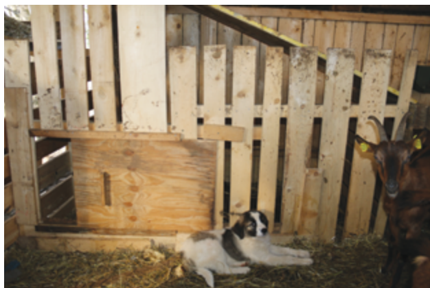
Immagine 11: Un cane giovane deve avere un posto dove rintanarsi.