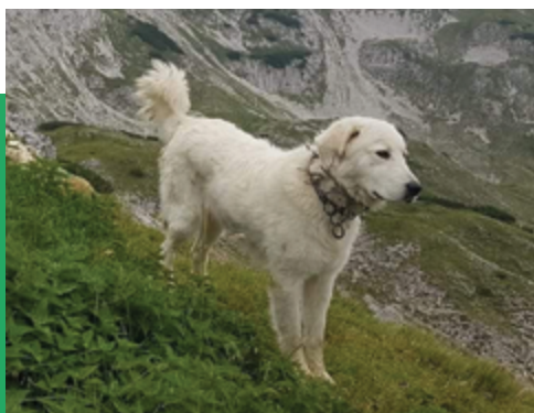
Immagine 6: Un "vracciale" o collare rivestito di aculei affilati che protegge la gola dei cani dai possibili morsi dei predatori.

E' importante che il cane venga regolarmente sottoposto alle vaccinazioni consigliate dal veterinario a seconda della zona frequentata, ivi compresa, per le aree alpine italiane, la vaccinazione antirabbica: sebbene l'Italia sia ufficialmente indenne dalla malattia, trattandosi di cani che potenzialmente possono venire in contatto con animali selvatici provenienti anche da molto lontano, la copertura vaccinale antirabbica è fortemente consigliata.