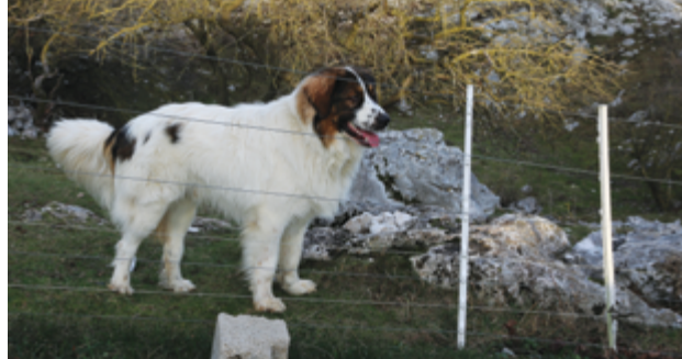
Immagine 15: La recinzione elettrificata impedisce la fuga dal pascolo.