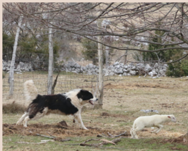
Immagine 16: Un giovane Tornjak che insegue un agnello.