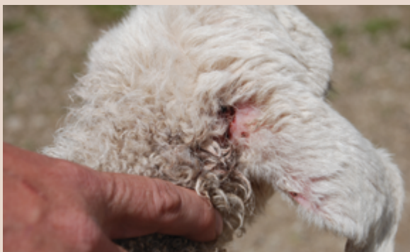
Immagine 18: Il risultato del morso è un danno visibile sul padiglione auricolare o su altre parti.

Così come nel caso di altri comportamenti indesiderati, dovremmo intervenire non appena si verifica il morso, dato che una reazione veloce è di cruciale importanza. Osservando il cane, riconosceremo i segnali che precedono il morso e saremo in grado di prevenire questo comportamento, ammonendo il cane prima che morda l'animale.