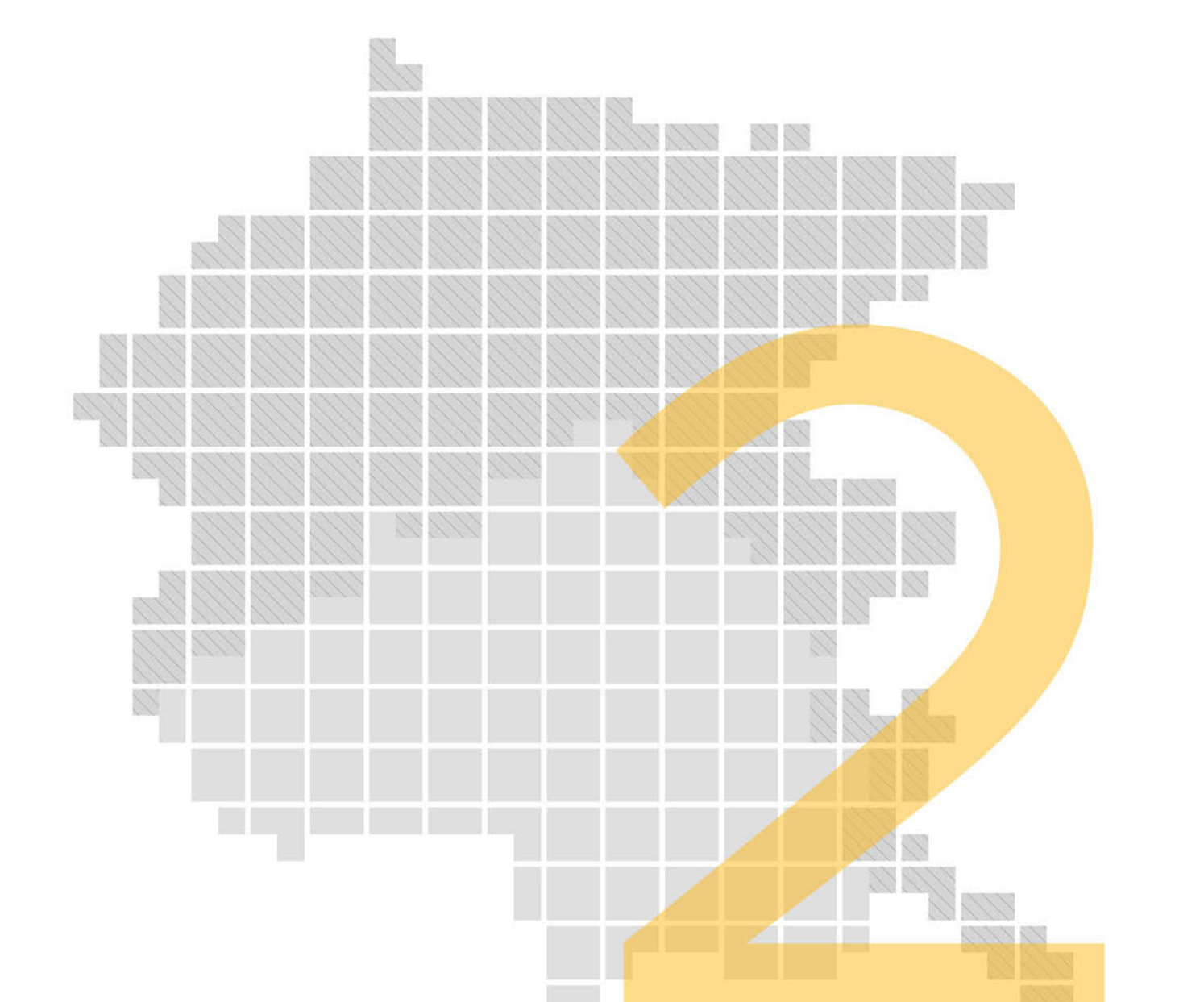
Tav. 0 Zona: REGIONE Istituti di gestione faunistico-venatoria

2/5 - allegato cartografico istituti gestionali: